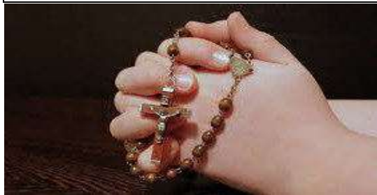
Ogni giorno si recita il Rosario in Chiesa alle ore 18.00